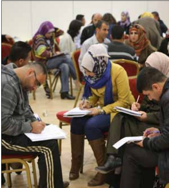
جانبا من فعاليات منتدى الدراما الرابع والعشرين.

يقترح سيتيريو في مقاله خطاطة تأخذ في الاعتبار تحول النظام التقليدي إلى «نظام المشروع»: