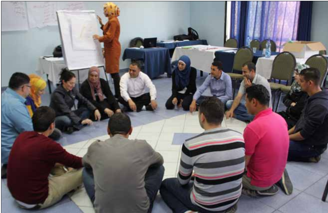
من أحد لقاءات مسار التكون المهني، بالتعاون مع منتدى المثقفين في قفيلية.

تسعى أغلب المشاريع إلى إنتاج عمل أصيل، وهو ما يرجع إلى مستوى الإنتاجات المتفرقة، حيث تكون أهداف التحويل والتعبير مفضّلة. هنا تكمن المشكلة بالنظر إلى أن أهداف التعبير: