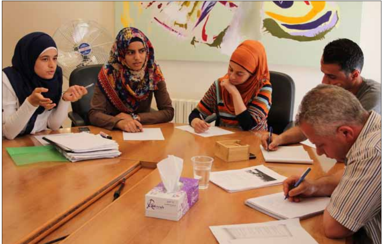
من أحد لقاءات مشروع «التعليم في ثورة» ضمن مسار التكون المهني.

أين يوجد «المشروع» في هذه العشرة بالمئة؟ يوجد بالأساس في إجراء الموافقة، ما دمنا لا نتحدث عن المشروع إلا لكي ندقق كيف يجب أن يضعه ويقدم هؤلاء إلى مجلس المؤسسة. إن القيام بالمشروع لا يعني بالضرورة قيادة نشاط مشروع، بل قبل كل شيء وضع منظور فعل تال للحصول على رأي مناسب. يتم كل شيء كما لو كانت المشاريع تشكل داخل نظام متحجر وفي أزمة، جواباً عن مشاكل كثيرة ومتعددة لم تُؤخذ في الحسبان في النظام التعليمي. إنها منطقة حرية نسبية تُترك للمدرسين، حيث لا تقترح عليهم أي منهجية مشروع